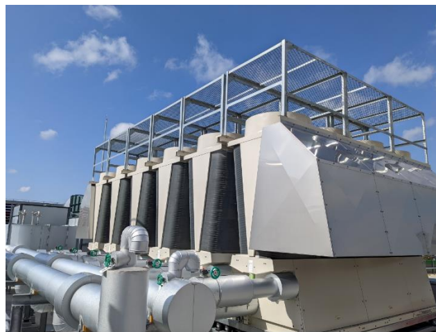
空調設備（ヒートポンプチラー）